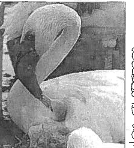
WÊRELDGESKIEDENIS word weer op Kamfersdam by Kimberley gemaak waar kleinflamink-kuikens nou op die kunsmatige broei-eiland hul opwagting maak. Terwyl hul ma's hulle meestal nog voed, begin hulle ook al self rondpik vir iets te ete.